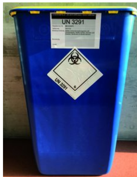
Verpackung klinische Abfälle

Für die Entsorgung gelten biologische Stoffe der Kategorie B und die klinischen Abfälle ebenfalls als Sonderabfälle. Sie werden jedoch den Abfallcodes 18 01 02 [S] Abfälle mit Kontaminationsgefahr oder bei verletzungsgefährlichen Abfällen (Nadeln, Skalpelle usw.) 18 01 01 [S] Abfälle mit Verletzungsgefahr (spitze oder scharfe Gegenstände – sharps) zugeordnet.