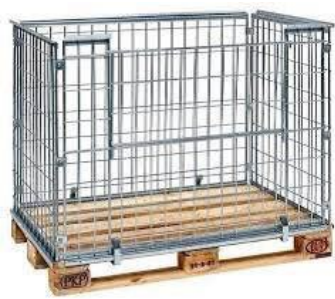
Gitterboxen (wenn nötig mit Auskleidung)