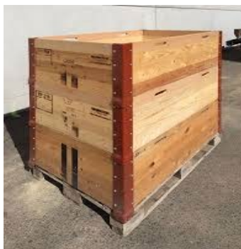
Paletten mit max. 4 Rahmen (wenn nötig mit Auskleidung)